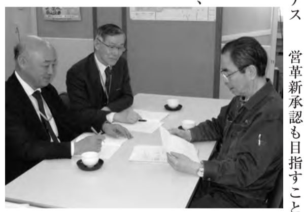
専門家からアドバイスを受ける社長(右)

企業概要 (株)ブレんズ ブロー成形機的设计・製造・販売、ガスバリア技術、表面改質シリコーン技術 住所 八幡北町1-4-5 TEL 41-3105 FAX 41-3659 URL http://www.blens.jp/