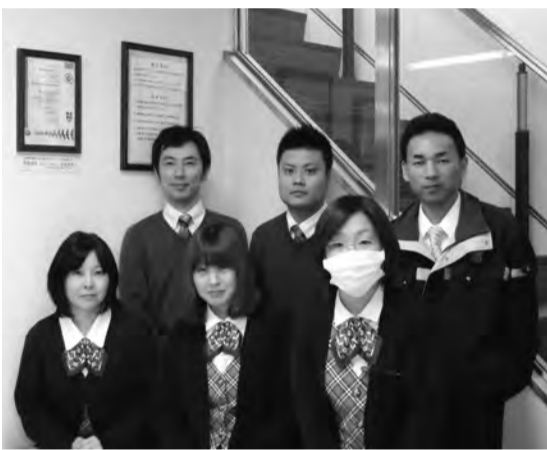
(株)アクアテックの皆さん

(株)アクアテック(市原市五所)は、半導体その他の電子機器部品及び工業プラスチック製品の製造業のほか、各種業務請負業を行っている。平成22年9月から中央環境事業協同組合の外国人技能実習生受入事業に賛同し、ベトナム人技術実習生を 親日感情が強く、東南アジアの中では教育水準が高くかつ手先が器用。また、日本とは政治形態は異なるものの国政が安定しているなどの、共通点が多い。 同社が中央環境事業協同組合を事業パートナーとして選んだのは、「今